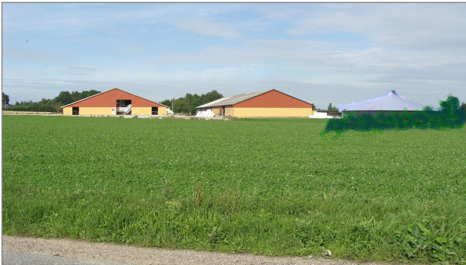
Visualisering af virkningen af placeringen af den ansøgte gyllebeholder med vold/beplantning i forhold til eksisterende produktionsanlæg set fra Regissevej.