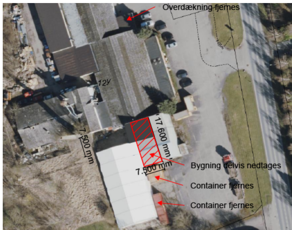
Kort over overdækningen og bygninger, der skal fjernes fra ejendommen og containere, der skal flyttes til ansøgt placering senest 1. september 2026.