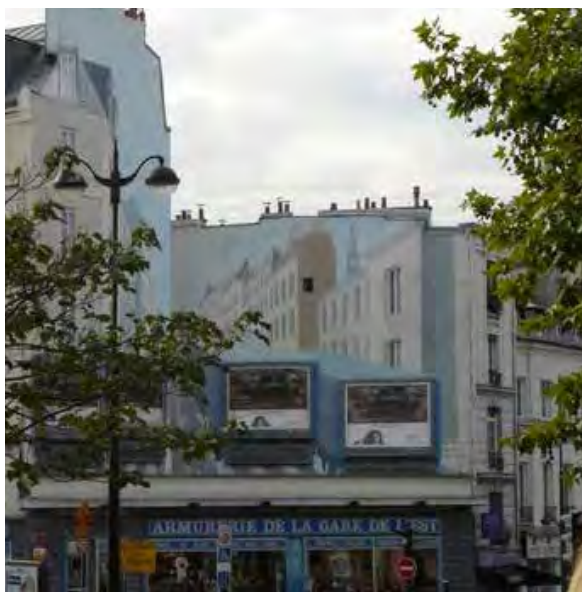
• Eksempel på kombination af gavlmaleri og billboards fra Paris