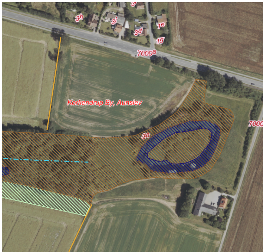
Figur 2: Luftfoto fra sommeren 2024 over matr.nr. 3a Korkendrup By, Aunslev, hvor der anmeldes skovrejsning. Markeret med gul ses dige BD.022.920, som afgrænser projektområdet mod vest.

anmeldte skovrejsningsprojekt ikke vil påvirke de landskabelige, kulturhistoriske eller biologiske interesser tilknyttet diget væsentligt.