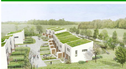
Eksempel på nyt byggeri i Jagtenborg med grønne tage.

Med hensyn til tagpap er der sket en udvikling, der gør at materialet ikke i samme grad som tidligere afgiver miljøskadelige stoffer til grundvandet.