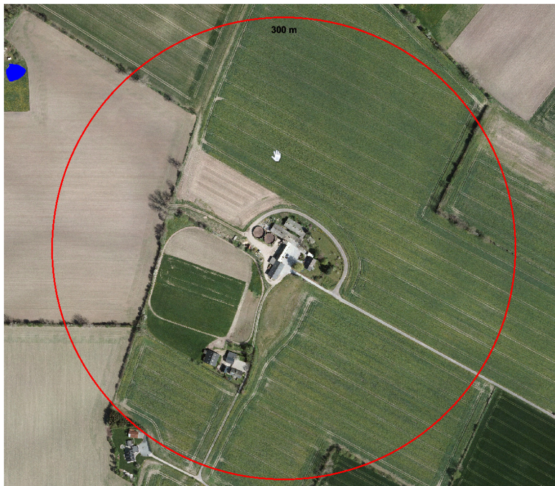
Oversigt over beliggenheden af produktionsanlægget på Egemosevej 5.

Nedenstående luftfoto viser beliggenheden af Egemosevej 5 i forhold til nærmeste omboende. Egemosevej 5 er beliggende i landzone.