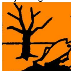
Miljøfarlig - N