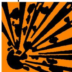
Eksplosiv – E