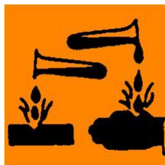
Ætsende – C