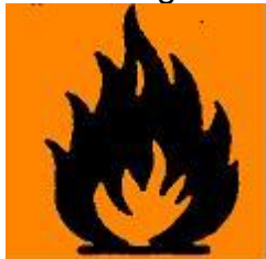
Brandfarlig – F