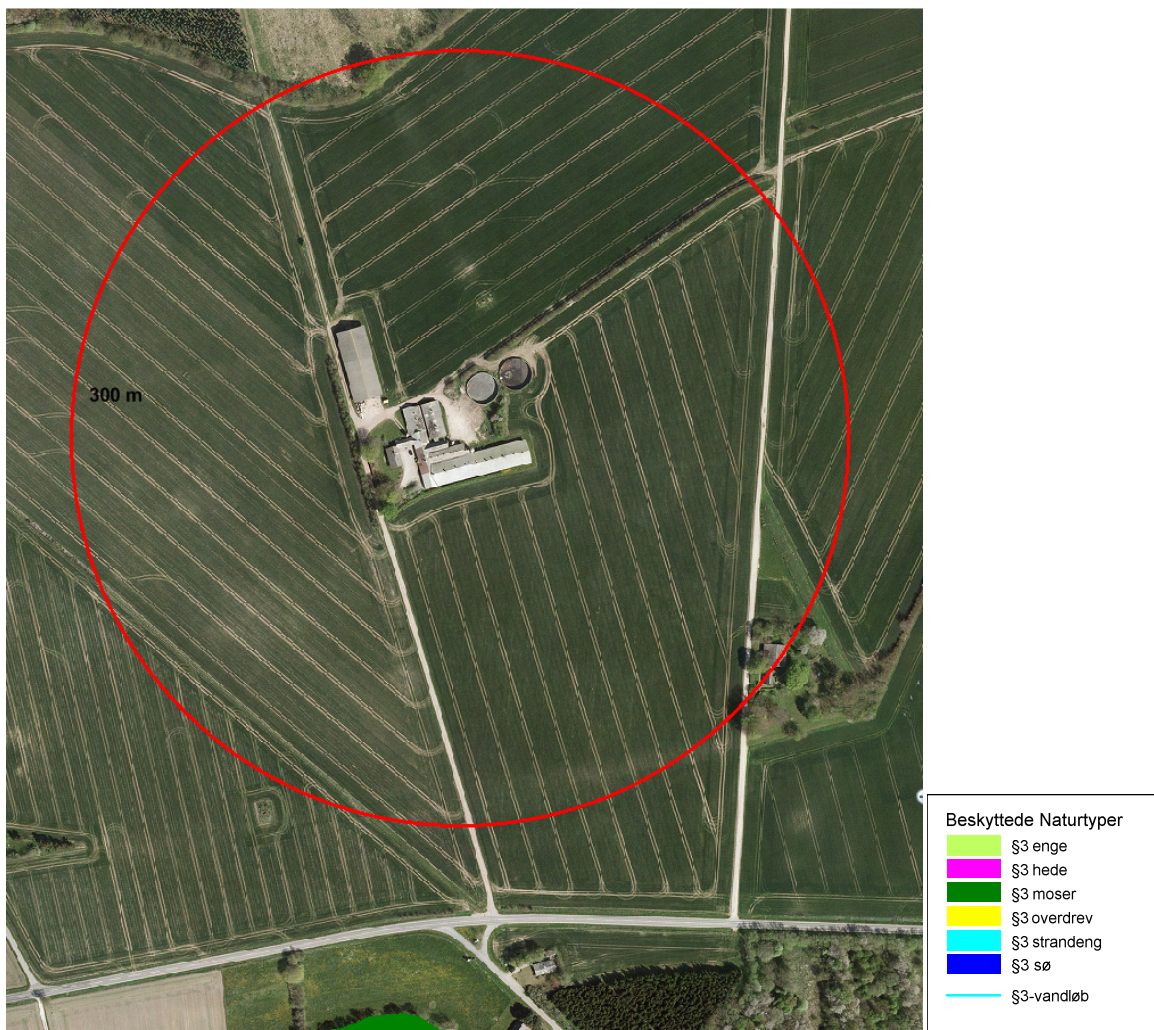
Oversigt over beliggenheden af produktionsanlægget på Assensvej 58.

Nedenstående luftfoto viser beliggenheden af Assensvej 58 i forhold til nærmeste omboende. Assensvej 58 er beliggende i landzone.