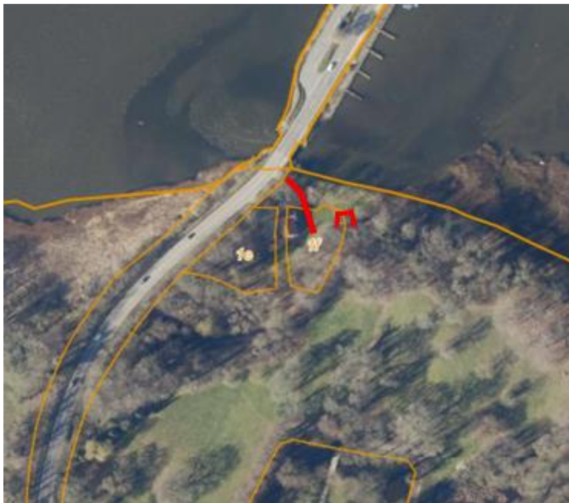
Matrikelkort med angivelse af ønskede placeringer af 2 stk. digestrækninger (rød markering)

Nyborg Kommune har modtaget ansøgning om tilladelse til at kunne etablere to digestrækninger, der skal fungere som værn mod oversvømmelse ved ejendommen Dyrehavevej 109, 5800 Nyborg.