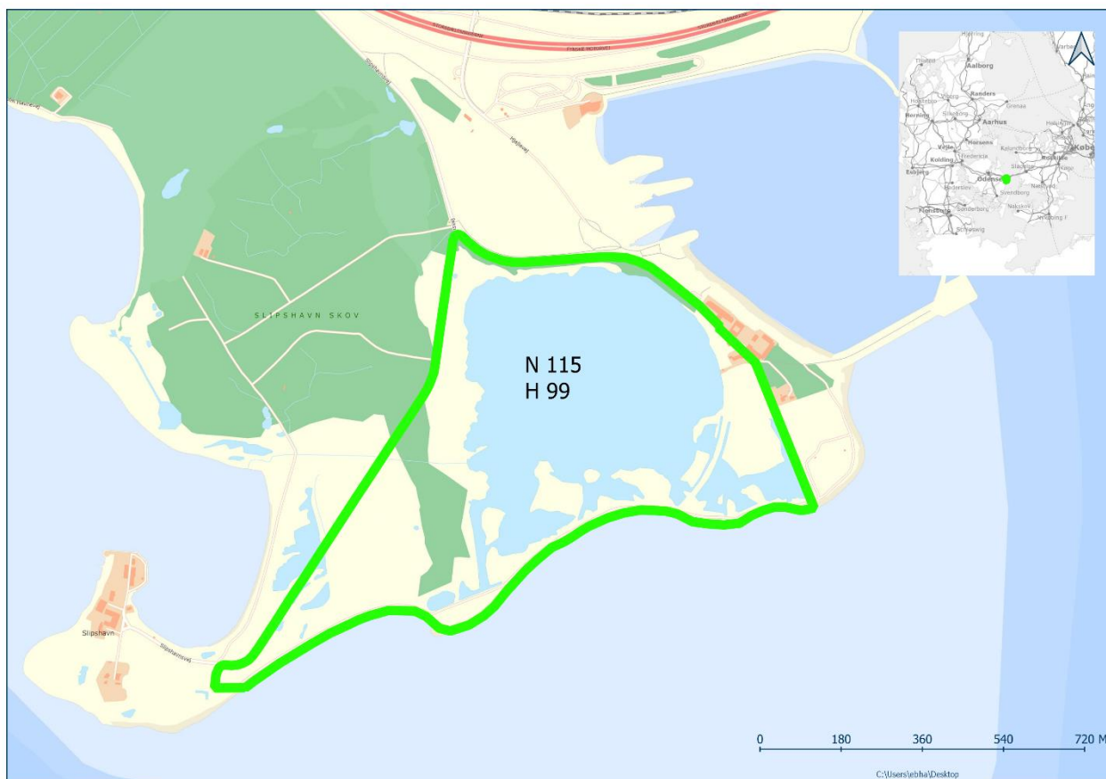
1: Afgrænsning af Natura 2000-område nr. 115 og habitatområde 99 (grøn afgrænsning).