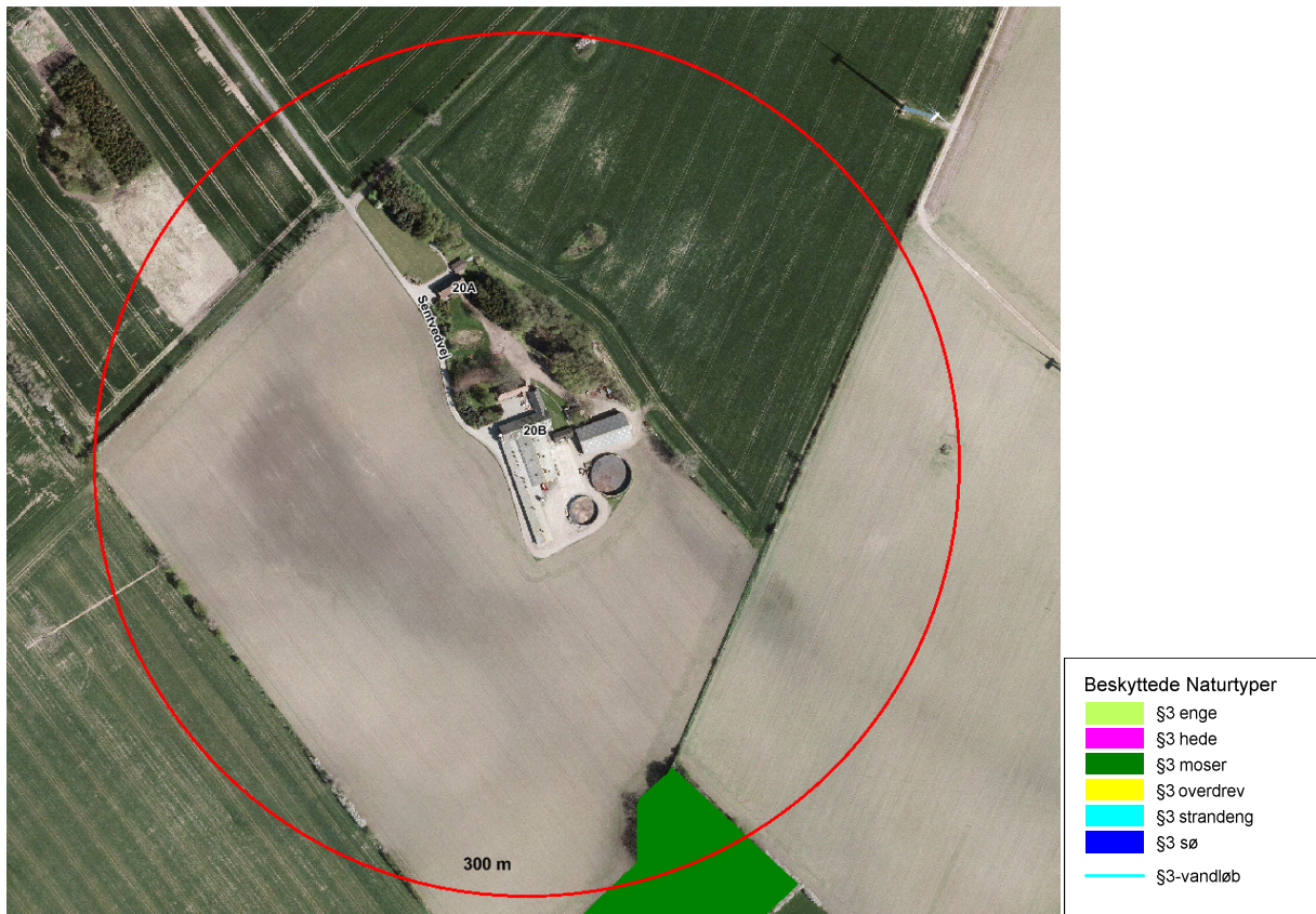
Oversigt over beliggenheden af produktionsanlægget på Sentvedvej 20B.

Nedenstående luftfoto viser beliggenheden af produktionsanlægget på Sentvedvej 20B i forhold til de nærmeste omboende m.v.. Ejendommen er beliggende i landzone.