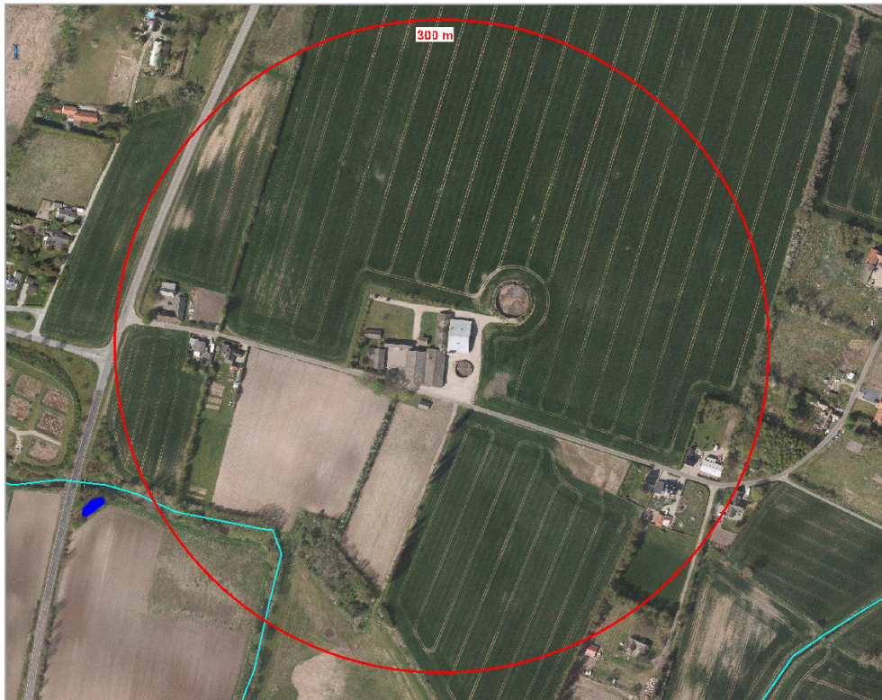
Oversigt over beliggenheden af produktionsanlægget på gedsbergvej 16.

Nedenstående luftfoto viser beliggenheden af Gedsbergvej 16 i forhold til nærmeste omboende. Gedsbergvej 16 er beliggende i landzone.