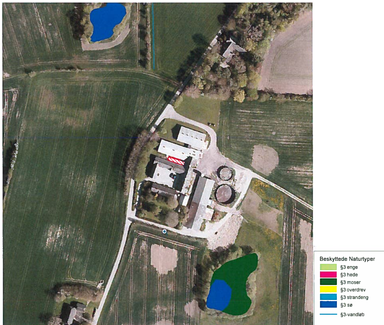
Oversigt over beliggenheden af produktionsanlægget på Kajbjergvej 14.