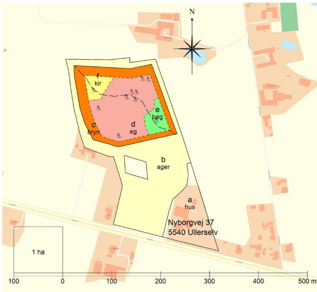
Figur 2 oversigtskort med matrikelgrænser og angivelser af områdets anvendelse.