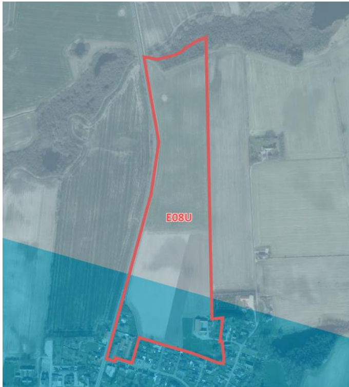
Figur 1: Drikkevandsinteresser, lyseblå markering er OD og mørkeblå OSD.

Området er for en størstedel af området beliggende inden for område med drikkevandsinteresser (OD), den sydlige del af området er beliggende inden for område med særlige drikkevandsinteresser (OSD). De grundvandsdannende oplande for hhv. Flødstrup og Ullerslev Vandværker ligger direkte under projektområdet.