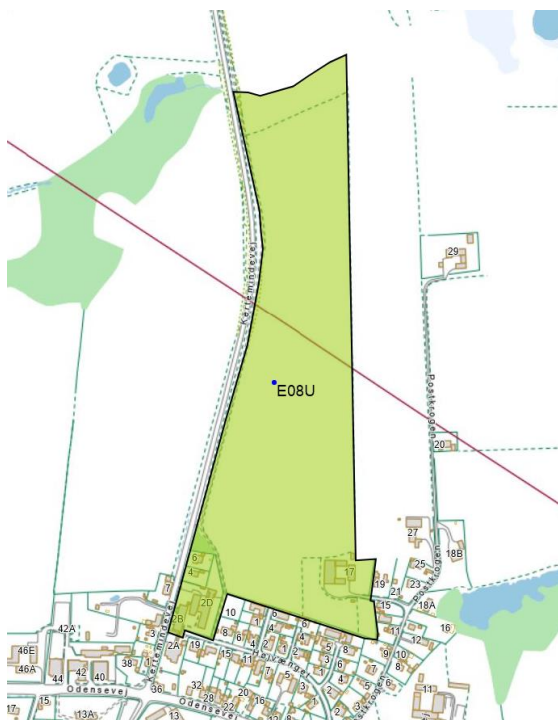
Figur 3: Områdets fremtidige status, grøn skravering markerer den nye afgrænsning for opland E08U, der separatkloakeres.

Ved vedtagelse af dette tillæg, ændres grænsen for opland E08U, så det svarer til området udlagt i lokalplan 319. Samtidig ændres kloakeringsprincippet fra ukloakeret/spildevandskloakeret til separatkloakeret.