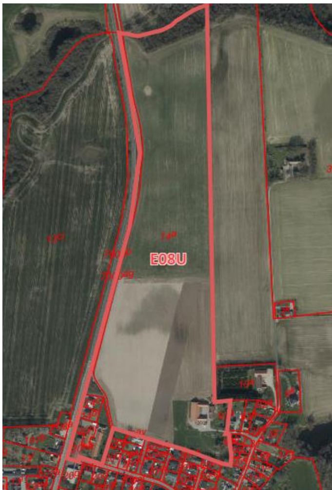
Figur 4: Berørte matrikler.