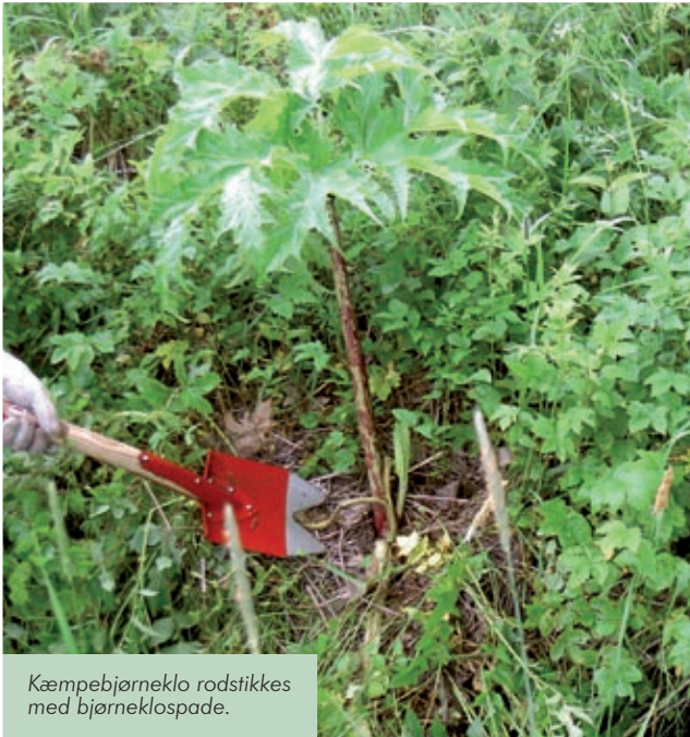
Kæmpebjørneklo rodstikkes med bjørneklospade.