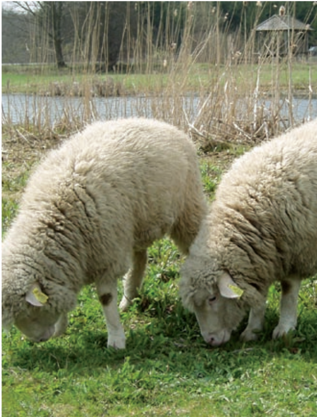
Får er velegnede til afgræsning af kæmpebjørneklo.